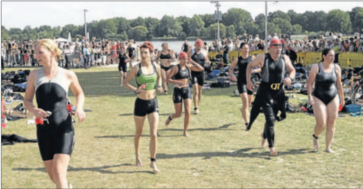
Die Zuschauer feuern die Sportler an, die aus dem Wasser kommen.